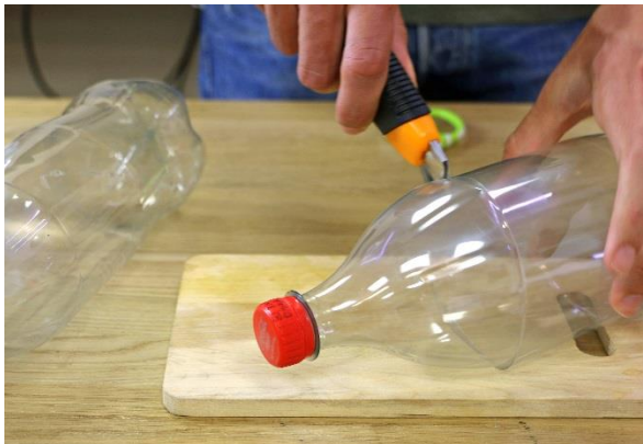
a. Schneide den „Kopf“ einer PET-Flasche mit dem Cutter ab (etwa 15 cm unter dem Verschluss).