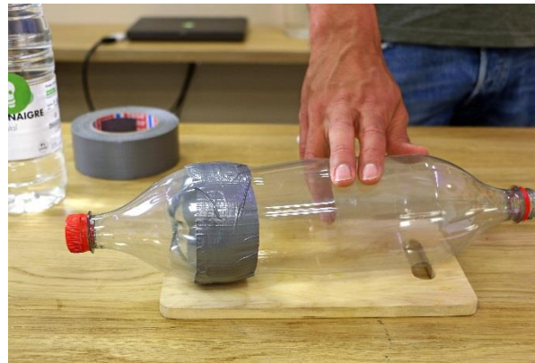
b. Schiebe diesen abgeschnittenen „Flaschenkopf“ über den Boden der anderen PET-Flasche und klebe ihn mit Panzertape fest.