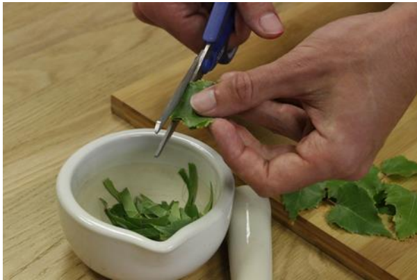
a. Grüne Blätter in kleine Stücke schneiden