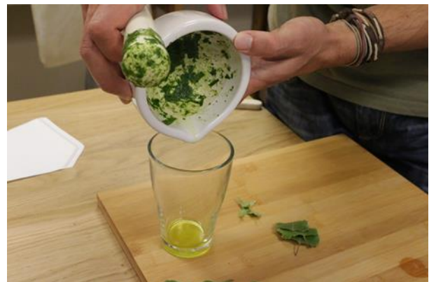
d. Saft in ein Glas geben