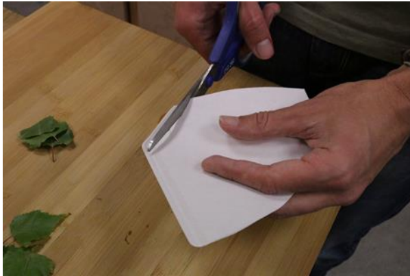
e. Kaffeefilter zurechtschneiden