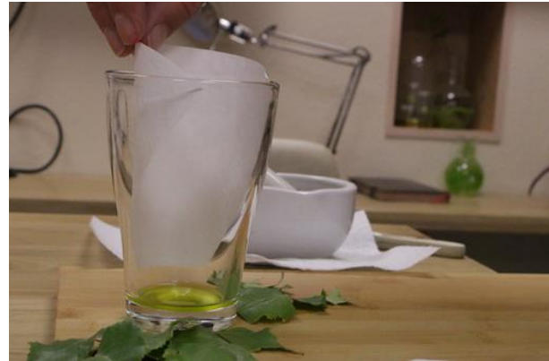
f. Kaffeefilter in die Flüssigkeit eintauchen