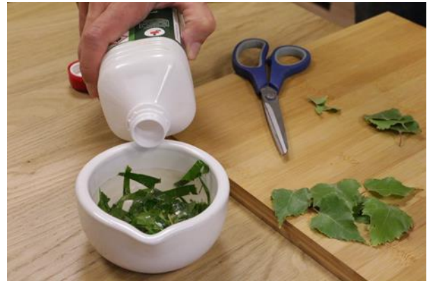
b. Mit Spiritus bedecken